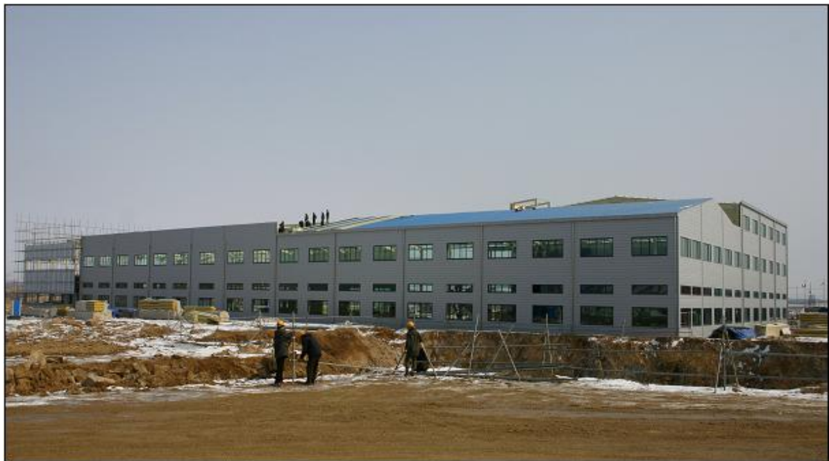
* 개성공단내 공장 건축 현장