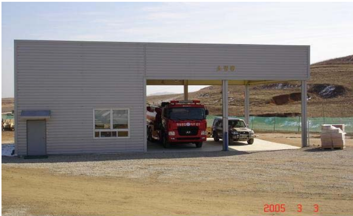
★ 개성공단내 소방시설