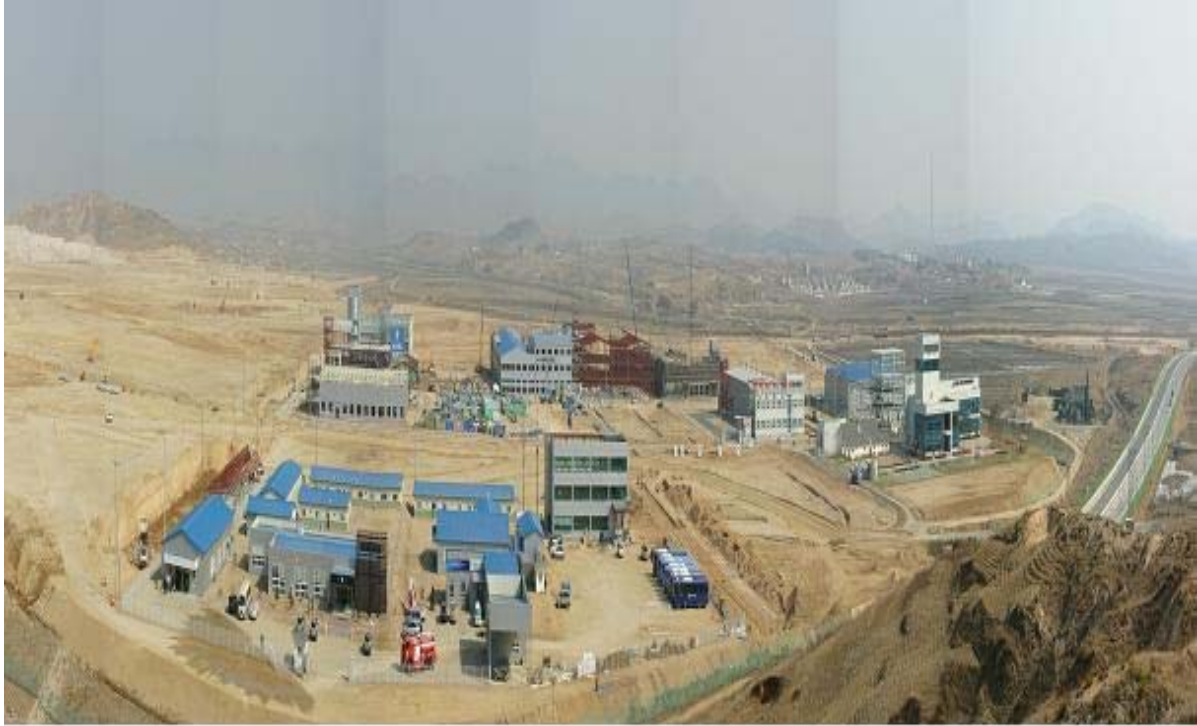
* 개성공단 시범단지 전경