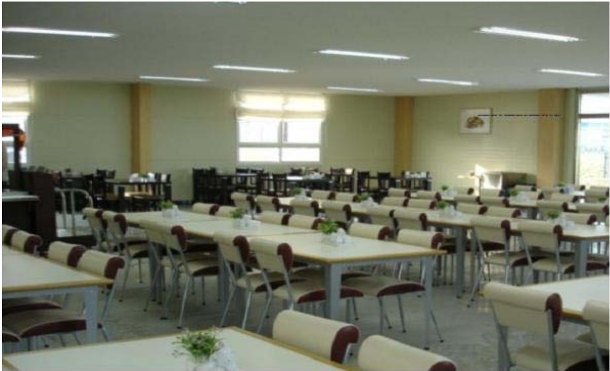
★ 개성공단내 편의시설(식당)