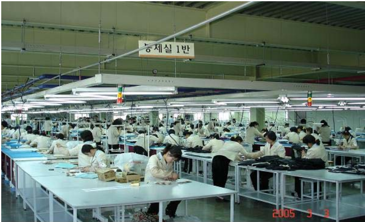
★ 개성공단내 북측 근로자 작업 모습