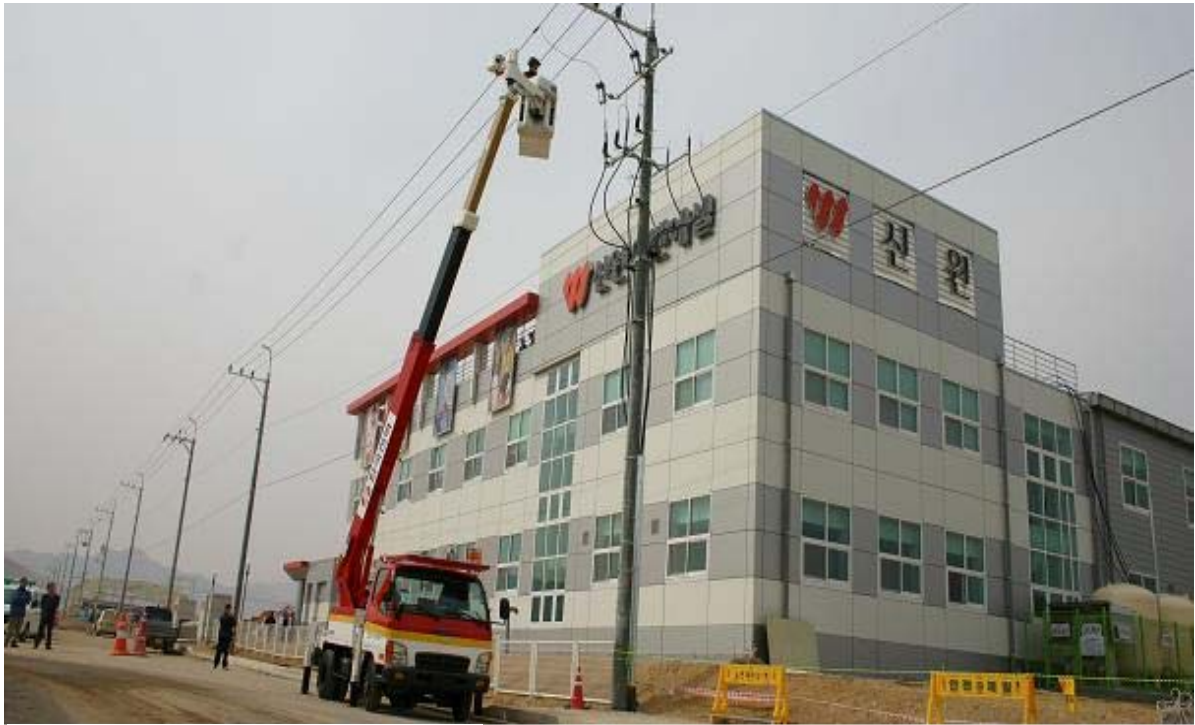
★ 개성공단내 전력공급 공사