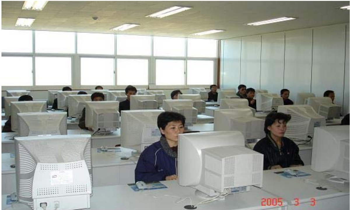
★ 개성공단내 북측근로자 실습교육