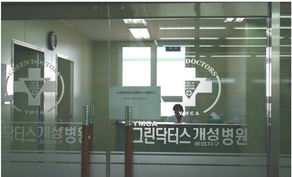
★ 개성공단내 편의시설(그린닥터스, 개성 현지 병원)