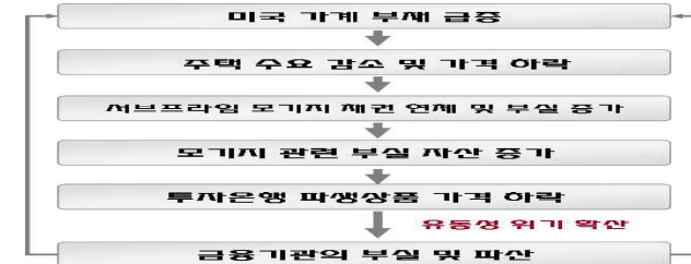
< 서브프라임 부실의 금융기관 전이 과정 >