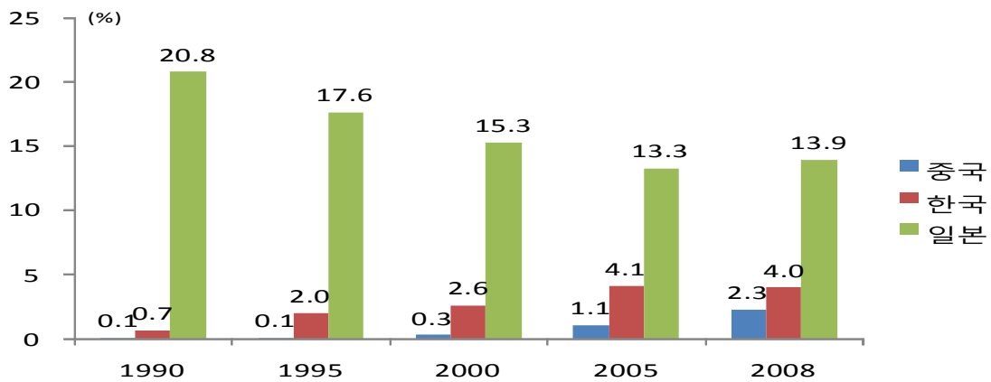
< 한중일 자동차산업 세계 수출 시장 점유율 추이 >