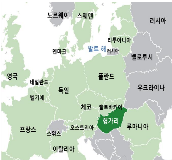
< 헝가리 위치 >