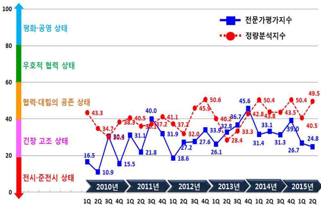
< 2010~2015 전문가평가지수와 정량분석지수의 추이 >