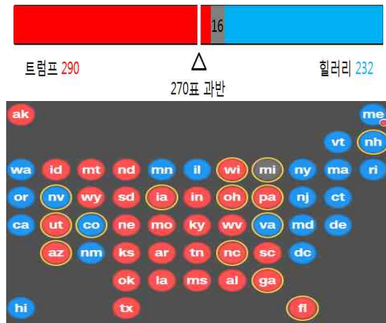
< 투표 결과 >