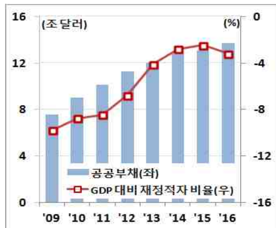
< 미국 정부 공공부채와 재정적자 >