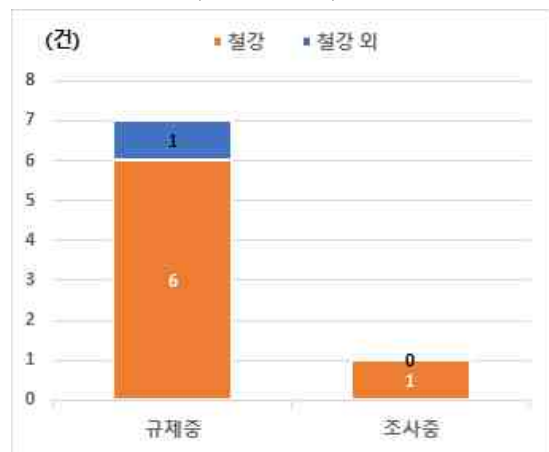
< 미국의 대한국 수입제재 현황 (상계관세) >