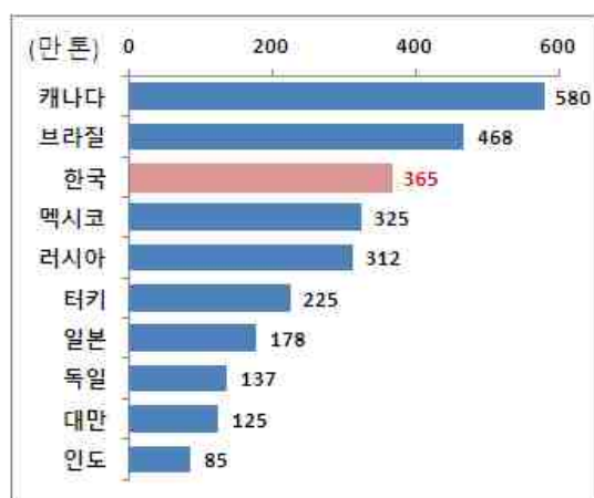
< 대미 철강수출 상위 10개국 >