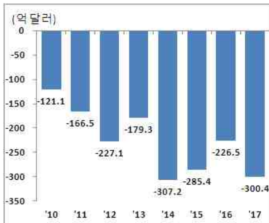
< 미국 철강 무역수지 >

○ 이에 본 보고서는 미국의 철강 제품에 대한 수입 관세 부과가 한국의 철강 산업에 미치는 영향을 분석하고 시사점을 도출하고자 함