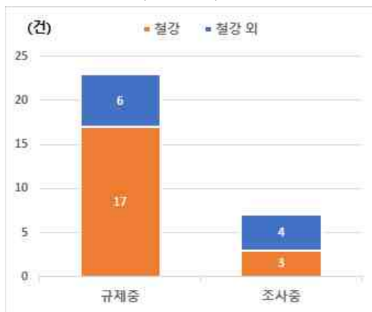
< 미국의 대한국 수입제재 현황 (반덤핑) >