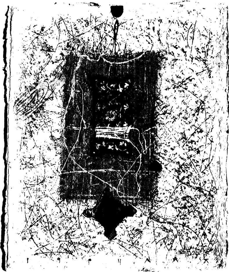
생활일기. 순닥지 + 아크릴릭 + 혼합재료, 65×54cm, 1994