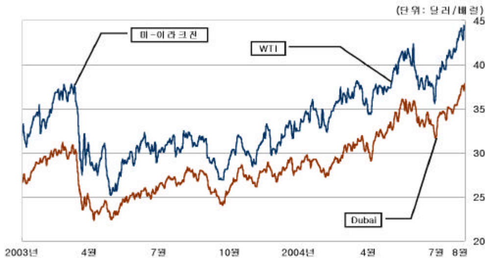
< 가 (WTI Dubai 油) >