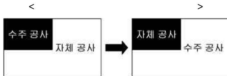
자체공사 비중 감소에 따른 사업 리스크 감소